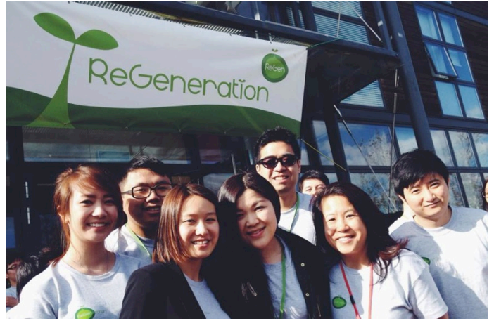
The young people at ReGen 參加 ReGen 營會的年輕人們