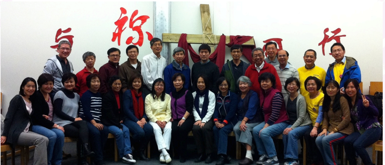
The short-term mission team members helping at the Easter Mandarin Camp 國語復活節營會短宣隊員