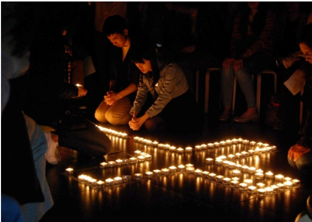
The students made commitment at the Mandarin Easter Camp 國語復活節營會中，同學們在燭光中再次立志