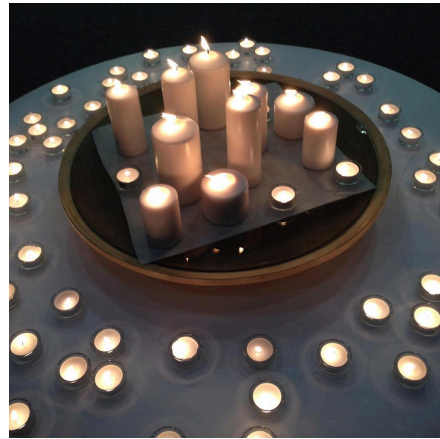
The prayer session at ReGen ReGen 營會中，年輕人們在燭光中彼此禱告