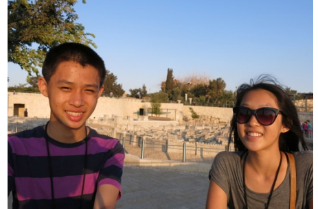
Thank God for parents, wife and children 感謝神賜父母、妻子、兒女