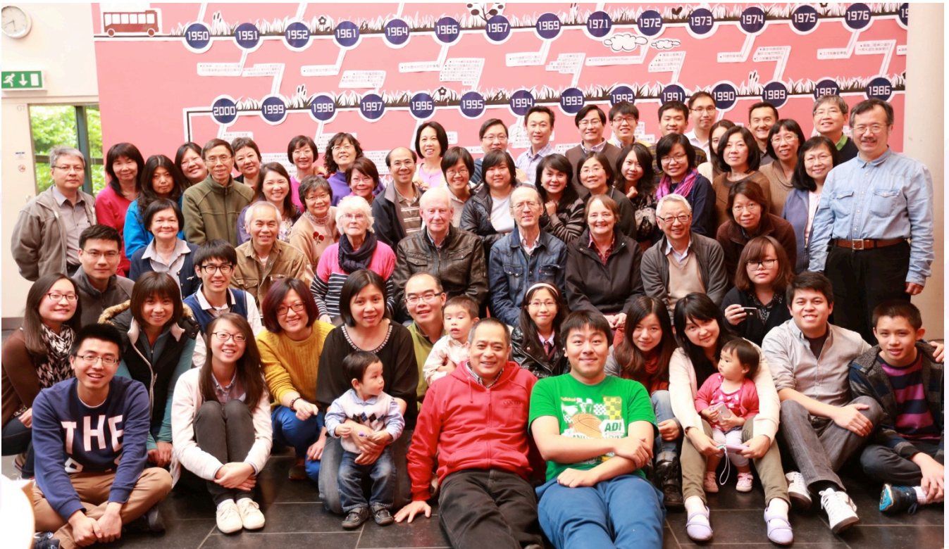
Thank God for big COCM family in Christ 感謝神在主裡賜下 COCM 這個大家庭